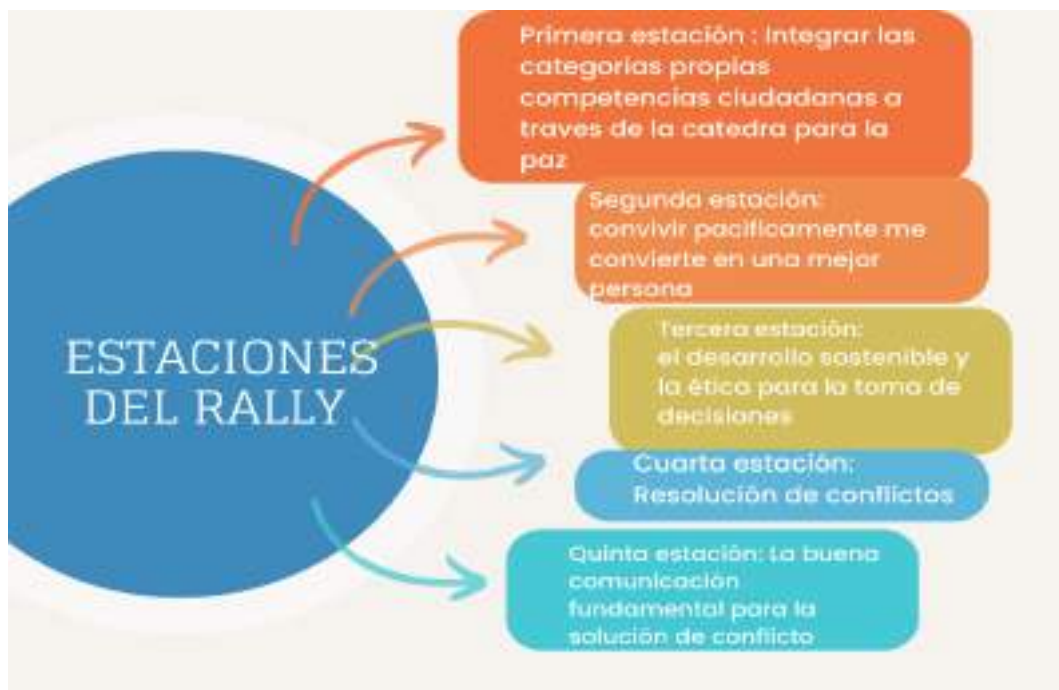
Estaciones del rally